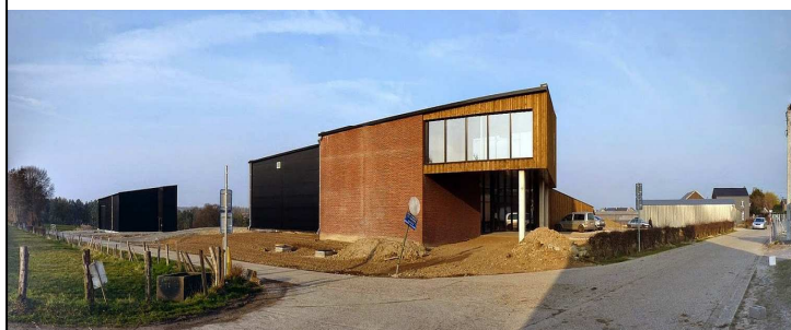
Le chai de la société coopérative « Vin de Liège » à Heure-le-Romain.

Enfin, l'ADL mène encore bien d'autres actions : "les Midis de l'Entreprise", la participation à l'étude de faisabilité d'une épicerie sociale, la Journée du Client, "les Ateliers pro" destinés aux entreprises, le soutien à l'installation d'une entreprise d'économie sociale « Vins de Liège », "les Ateliers du Commerce", les permis socioéconomiques, la promotion de formations en langues pour les demandeurs d'emploi et de formations qualifiantes de type e-learning (avec Technifutur) ou PMTIC, la promotion des hébergements et des restaurants et l'intégration des sites du Hemlot et de la Gravière Brock dans le projet touristique Euregio "Au fil de l'eau".