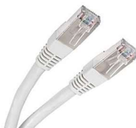
Câble réseau 2

→ Il lui faut entre 10 et 15 minutes pour s'allumer.