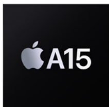
Puce A15 Bionic